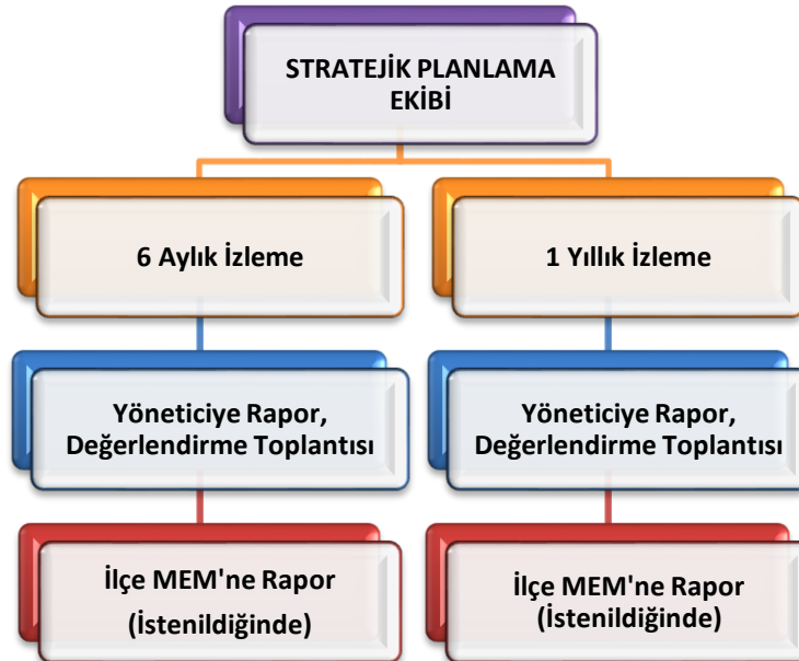
Şekil 2 Stratejik Plan İzleme ve Değerlendirme Modeli

Müdürlüğümüzün 2024-2028 Stratejik Planı İzleme ve Değerlendirme sürecini ifade eden İzleme ve Değerlendirme Modeli hazırlanmıştır. Okulumuzun Stratejik Plan İzleme-Değerlendirme çalışmaları eğitim-öğretim yılı çalışma takvimi de dikkate alınarak 6 aylık ve 1 yıllık sürelerde gerçekleştirilecektir. 6 aylık sürelerde Okul Müdürüne rapor hazırlanacak ve değerlendirme toplantısı düzenlenecektir. İzleme-değerlendirme raporu, istenildiğinde İlçe Milli Eğitim Müdürlüğüne gönderilecektir.